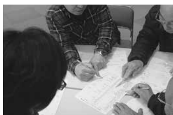
被災者からの要望と派遣するボランティアを調整する作業の模擬訓練 講師：熊野市社会福祉協議会 地域福祉係職員