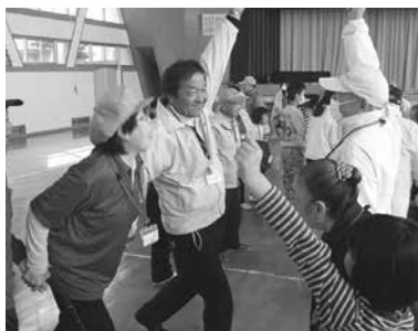
3人の体を使って対戦チームとじゃんけんポン!