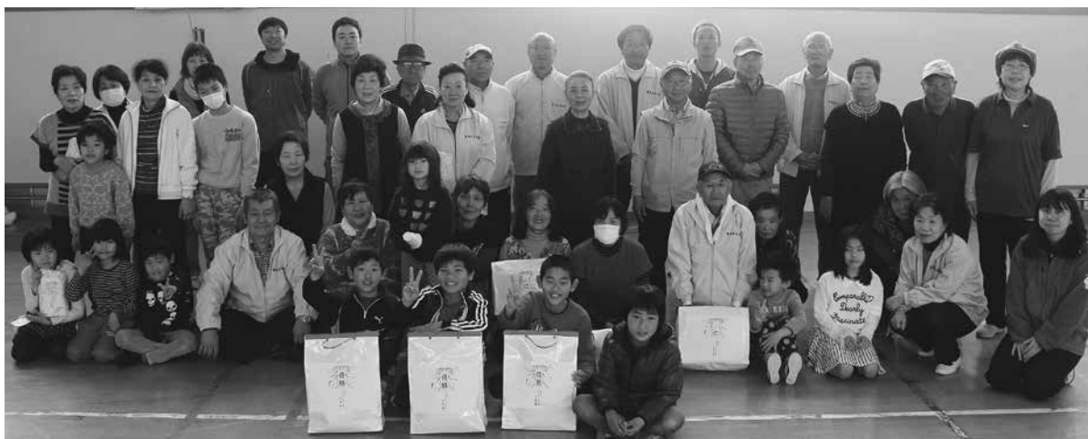
みなさんの表情が柔らかくなった終了後に記念写真をパチリ