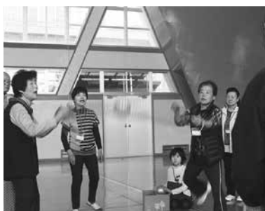
両端をもったネットから放たれるボールをバケツでキャッチ!

子供から高齢者まで幅広い世代の交流を図ることを目的として、地域の力をお借りしながら開催している「ふれあいレクリエーション大会」。今回の舞台となったのは木本地区で、39名の方々に参加いただきました。誰でも気軽に行えるレクリエーションとはいえ、豪華(?)賞品がかかった三人一組のチーム対抗戦となると白熱した場面も…。会場は笑顔と歓声があふれていました。