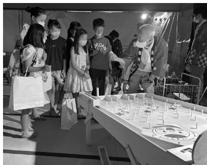
前は「くましゃんのなつまつり」