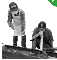
熊野少年自然の家