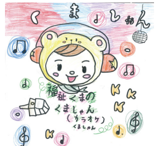
「ナビゲーターホワイト」さん